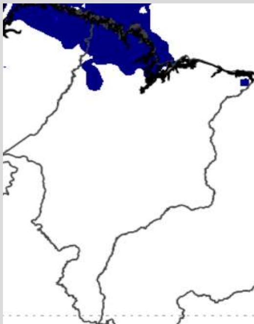
MODELO COSMO DE PREVISÃO - INMET